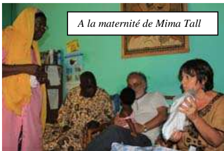
A la maternité de Mima Tall

Une de nos sympathisantes, travaillant à l'aéroport de Nice est intervenue auprès de Royal Air Maroc afin que cette compagnie nous autorise des kilos supplémentaires dans nos bagages. Nous avons ainsi pu apporter plus de 400 kg. D'autres amis, nous ont offert des vêtements bébés, enfants, adultes, des casquettes, des manuels